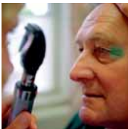
Kliniska prövningar görs för att säkerställa framtida nya, trygga och effektiva läkemedel.